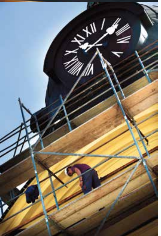
A Nagytemplom felújítás közben