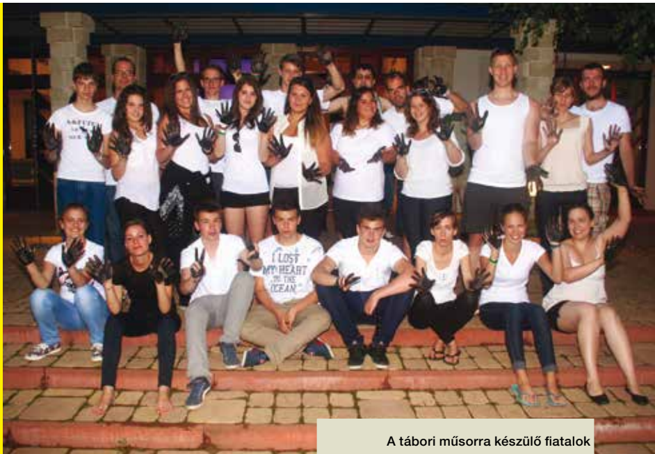
A tábori műsorra készülő fiatalok