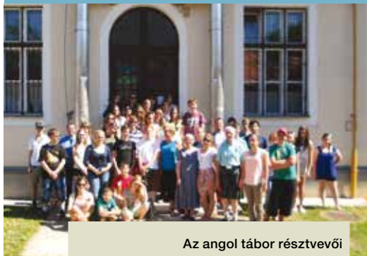
Az angol tábor résztvevői

Minden reggel magyar és angol énekekkel hangolódtunk rá az aznapi történetre. Az első reggelen egyszer csak úgy hallottam, mintha magyarul énekelne valaki mellettem, pedig tudtam jól, hogy mindkét oldalamon egy-egy skót vendég ül. Ahogy oldalra néztem, láttam, hogy közülük többen is próbálnak velünk együtt magyarul énekelni. Meg-