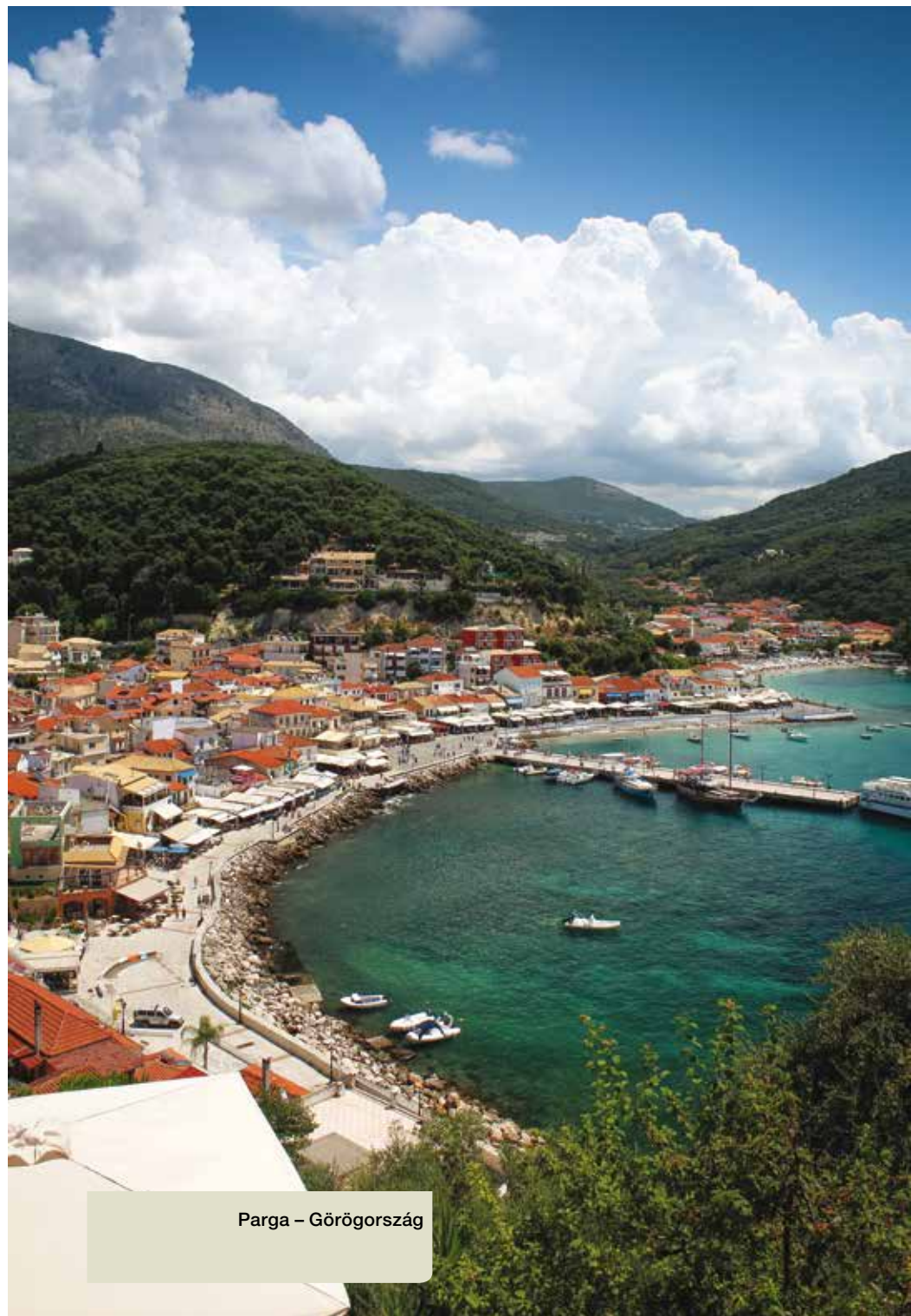
Parga – Görögország