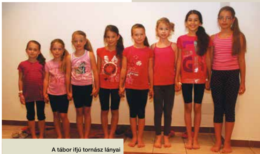
A tábor ifjú tornász lányai